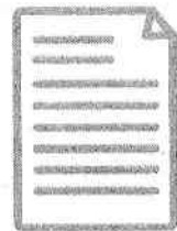
露店等開設届出 （5日前まで）