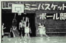
ミニバスケットボール部

各競技の普及・競技力の向上及び体力の増進を目指すとともに、心身ともにたくましい子どもたちの育成を図ることを基本方針に、金沢区内の中学校では、市や県の中学校体育連盟と連携し活動を行っています。公立10校と私立2校が金沢区大会に参加しています。15競技ありますが、生徒数や部活動数には限りがあり、顧問の確保など課題を抱えながらも、頑張っています。将来、地域のスポーツ振興の担い手となるよう、ご支援・ご協力をお願いいたします。