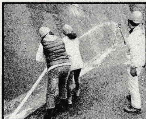
地域住民による放水訓練

概要：地域住民と消防団等が協力し、スタンドパイプ式初期消火器具の取扱訓練や救助訓練など、実際に災害が発生した状況を想定して行われました。消防団等による説明を熱心に聞く地域の方の前向きな姿勢から、災害に対する危機感が伝わり、共助に向けた取り組みの模範といえる活動でした。