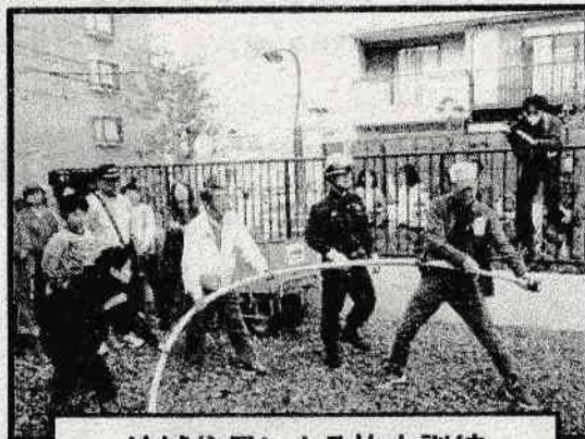
地域住民による放水訓練