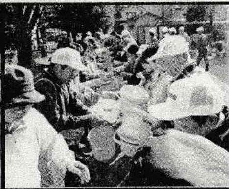
全員で協力！バケツリレー