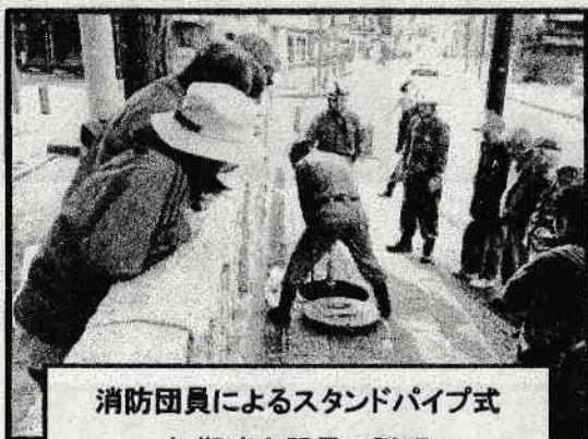
消防団員によるスタンドパイプ式 初期消火器具の説明

概要：木造住宅密集地域を持つ、3つの町内会が集まり、消防団員が中心となって、スタンドパイプ式初期消火器具を使用した訓練が行われました。自分たちの街は、自分たちが守るという強い気持ちが伝わってくる訓練でした。